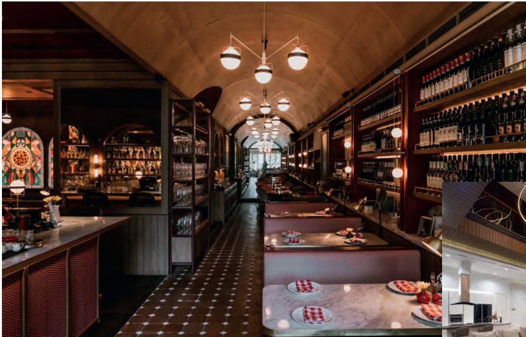
Siluet eksklusif interior ruang makan Osteria Gio di Pacific Place yang bergaris rancang kontemporer.