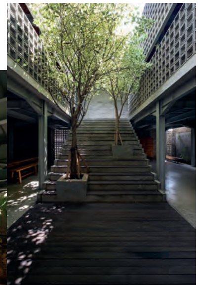
Elemen natural material dalam dipertahankan sebagai titik penentu utama keindahan desain ruang modern.